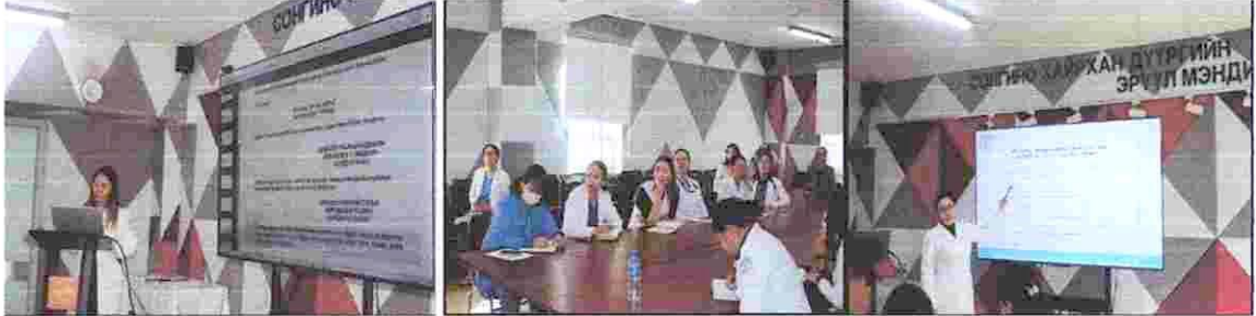
Зураг 2. Албан хэрэг хөтлөлтийн сургалт

Газар хөдлөлтийн гамшгийн аюулаас урьдчилан сэргийлэх, эрсдэлийг бууруулах, бэлэн байдлыг хангах, аврах үйл ажиллагаанд хүн амыг сургаж бэлтгэх талаар Монгол Улсын Засгийн газрын 2011 оны 339, 340 дүгээр тогтоолын хэрэгжилтийг хангах бэлтгэл ажлын Сонгинохайрхан дүүргийн Эрүүл мэндийн төвд зохион байгуулж, гамшгийн аюулын зарлан мэдээлэх дохиогоор ажиллах зөвлөмж, сургалтад танхимаар дүүргийн Онцгой байдлын хэлтсээс 03 дугаар сарын 24-нд “Газар хөдлөлтийн гамшгийн аюулаас урьдчилан сэргийлэх, эрсдэлийг бууруулах, бэлэн байдлыг хангах, аврах үйл ажиллагаанд хүн амыг сургаж бэлтгэх” сургалтыг зохион байгуулсан. Сургалтад нийт 99 эмч, эмнэлгийн мэргэжилтэн, ажилтан, албан хаагч нар хамрагдсан