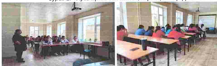
Зураг 2. “Хувь хүний зан төлөв, харилцаанд үзүүлэх нөлөө” сургалт

2. ЭГО - Хувь хүний зан төлөв, харилцаанд үзүүлэх нөлөө” сэдэвт сургалтыг 03 дугаар сарын 10 өдөр байгууллагын ажилтан, албан хаагчдад зохион байгуулсан. Сургалтын өмнөх мэдлэгийн түвшинг үнэлэхэд оролцогчдын ихэнх нь эго болон харилцааны талаарх ойлголт дутмаг байсан бол сургалтын дараа өөрийгөө танин мэдэх, бусдыг ойлгон хүндэтгэх, багаар ажиллах чадварын талаарх мэдлэг, ойлголт мэдэгдэхүйц нэмэгдсэн үзүүлэлттэй байв. Сургалтын БГД-н Насан туршийн суралцахуйн төвийн багш Х.Гантуул орсон. Сургалтад 20 ажилтан, албан хаагчид хамрагдсан.