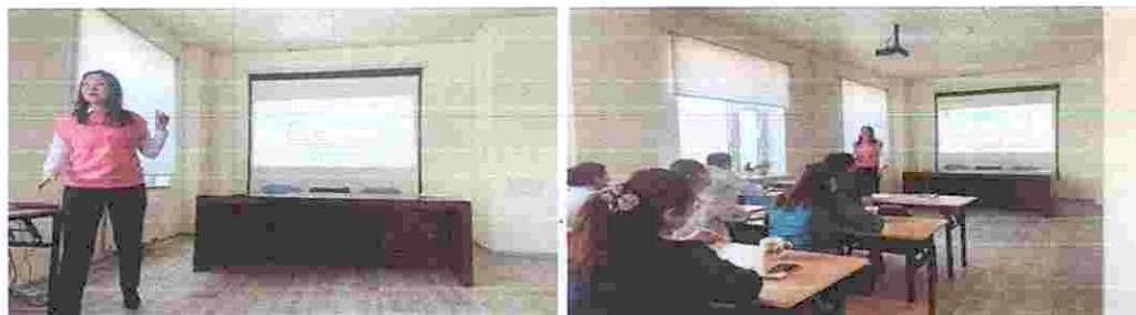
Зураг 4. “Эрүүл мэндийн байгууллагын соёлд ёс зүй” сургалт

3. “Эрүүл мэндийн байгууллагын соёлд ёс зүй, үйлчилгээний стандартыг нэвтрүүлэх нь” сэдэв сургалтыг 03 дугаар сарын 05 өдөр зохион байгуулсан. Сургалтаар эрүүл мэндийн байгууллагуудад ажиллаж буй эмч, эмнэлгийн мэргэжилтэн, ажилтан, албан хаагчдын ёс зүй, харилцаа, эерэг хандлагыг төлөвшүүлэх, танин мэдэхүйд суурилсан энэрэх сэтгэл, үе хоорондын ялгаа, сэтгэл хөдлөлөө таних, зохицуулах аргууд, авилгын талаарх олон улсын хандлага, баримтлаж буй бодлого, эрх зүйн орчны талаарх ойлголтуудыг өгөхөөс гадна авилгаас урьдчилан сэргийлэх болон хүлээх хариуцлагын талаарх хичээлийг орж, багаар ажиллан хэлэлцүүлэг зохион байгуулсан. Сургалтад нийт 33 эмч, сувилагч, эмнэлгийн мэргэжилтэн хамрагдсан.