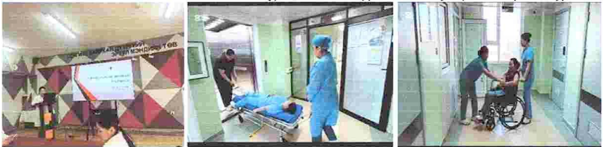
Зураг 12. "Үйлчлүүлэгчийг аюулгүй тээвэрлэх" сургалт

12. СХДЭМТ-ийн Чанарын алба, Мэдрэлийн өвчин судлалын тасгийн чанарын багийн гишүүд хамтран УГТЭ-ийн Харвалтын баг хамт олноос " БҮЛЭН УУСГАХ ЭМЧИЛГЭЭ " сэдэвт сургалтыг 02 дугаар сарын 05-ний өдөр зохион байгуулсан. Сургалтанд СХДЭМТ-ийн Мэдрэл, Дүрс оношилгоо, жижүүрийн эмч нар, сувилахуйн баг хамт олон хамрагдсан. Сургалтанд нийт 45 хүн оролцсон.