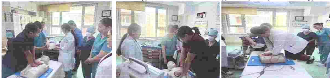
Зураг 5. "Хөх код идэвхжүүлэх гардан үйлдлийн " сургалт

5. Гар угаах, халдваргүйжүүлэх ЭМС-н 537 дугаар тушаалын 1-р хавсралтын хэрэгжилтийг сайжруулах сэдэвт сургалтыг 05 дугаар сарын 05 өдөр зохион байгуулсан. Сургалтаар гар угаах нөхцөл бүрдүүлэлт, эмнэлгийн ажилтны гарт тавигдах шаардлага, гарын ариун цэвэр сахих мөч, угаах дараалал, гарыг хэрхэн угааж халдваргүйтгэх арга техникийг гардан хийж гүйцэтгэсэн.Сургалтад МӨСТ-н нийт 8 сувилагч хамрагдсан.