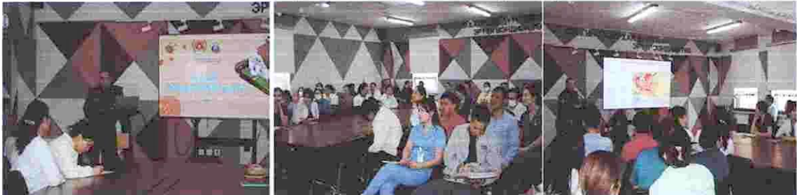
Зураг 3. “Газар хөдлөлт гамшгийн аюулаас урьдчилан сэргийлэх” сургалт

3. Сувилахуйн албанаас өрхийн сувилагч нарт амилуулах тусламж үзүүлэх хөх код идэвхижүүлэх талаар сургалтыг 03 дугаар сарын 04 өдөр хийж мэдлэг ур чадварыг дээшлүүлэх, тохиолдол эрсдэлээс сэргийлэх, эмчлүүлэгчийн аюулгүй байдлыг хангах зорилгоор зохион байгууллаа.