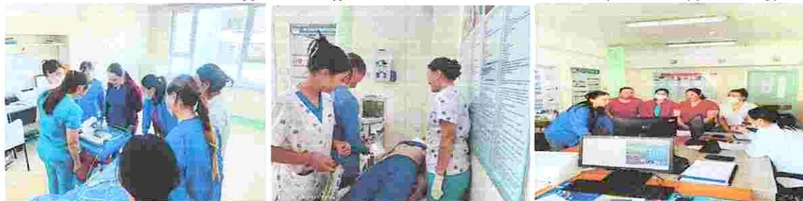
Зураг 10. "Зүрхний цахилгаан бичлэг стандартын дагуу хийх" сургалт

10. Хэвтүүлэн эмчлэх тасгийн сувилагч нарт сургалтыг 02 угаар сарын 06-ний өдөр зохион байгуулсан. Мөн шээлгүүр тавих арга зүйгээр стандартын дагуу мультимедиа дээр ажилбарыг хийж гүйцэтгэн үзүүлсэн. Уг сургалтаар дараах мэдлэг олгов.