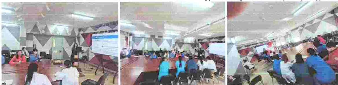
Зураг 1. “Судалгааны арга зүй” сургалт

2. ЭГО - Хувь хүний зан төлөв, харилцаанд үзүүлэх нөлөө” сэдэвт сургалтыг 03 дугаар сарын 10 өдөр байгууллагын ажилтан, албан хаагчдад зохион байгуулсан. Сургалтын өмнөх мэдлэгийн түвшинг үнэлэхэд оролцогчдын ихэнх нь эго болон харилцааны талаарх ойлголт дутмаг байсан бол сургалтын дараа өөрийгөө танин мэдэх, бусдыг ойлгон хүндэтгэх, багаар ажиллах чадварын талаарх мэдлэг, ойлголт мэдэгдэхүйц нэмэгдсэн үзүүлэлттэй байв. Сургалтын БГД-н Насан туршийн суралцахуйн төвийн багш Х.Гантуул орсон. Сургалтад 20 ажилтан, албан хаагчид хамрагдсан.