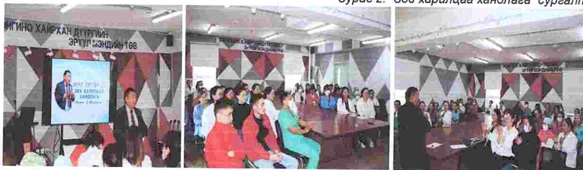
Зураг 2. “Зөв харилцаа хандлага” сургалт