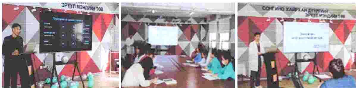
Зураг 1. Шинэ ажилтныг чиглүүлэх сургалт

1. Шинээр ажилд томилогдсон ажилтнуудыг зааж чиглүүлэх, ажилтныг богино хугацаанд байгууллага хамт олны нэгэн хэсэг болгох, хүний нөөцийн тогтвортой үйл ажиллагааг хангах зорилгоор “ШИНЭ АЖИЛТНЫГ ЧИГЛҮҮЛЭХ” сургалтыг 4 удаа зохион байгуулж нийт 37 ажилтан хамрагдсан байна.