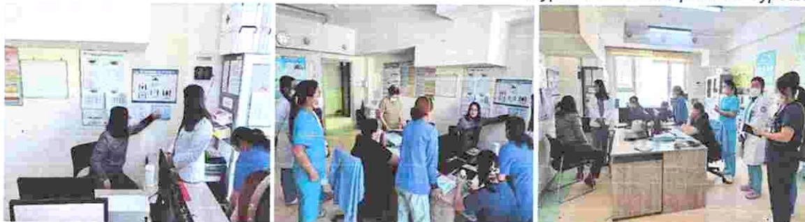
Зураг 14. “Глазго үнэлгээ” сургалт

14. Улаанбурхан өвчин болон менингококкт өвчний эрт илрүүлэлт, оношилгоо, тандалт, голомтын арга хэмжээ болон дархлаажуулалтын талаарх мэдлэг, чадварыг нэмэгдүүлэх, өвчний тархалтыг таслан зогсоох хариу арга хэмжээний талаар мэдлэг, мэдээлэл олгох сургалтыг СХДЭМТ-ын Поликлиник, ЯТЭЭТ-ын эмч ажилчид-18 ӨЭМТ-ийн эмч нарт-26 нийт- 44 ажилтанд хамрагдаж, сэдвийн дагуу 5 асуумж тест бэлтгэж, мэдлэгийн тест авсан. Мэдлэг шалгах өмнөх бэлтгэсэн тестийн дүн 68 хувьтай байсан бол сургалтын дараах мэдлэг шалгах тестийн дүнд 92 хувьтай дүгнэлт гарч, үүнээс үзэхэд мэдлэгийн түвшин нэмэгдсэн харагдаж байна.