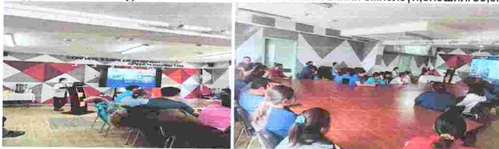
Зураг 15. “Улаанбурхан өвчин болон менингококкт өвчний эмнэлзүй, оношилгоо, эмчилгээ”

15. СХД-ийн ӨЭМТ-үүдийн сувилагч тусгай мэргэжилтнүүдэд Хүний папиллома вирусийн халдварын эсрэг дархлаажуулалтын үеийн болзошгүй урвал, дархлаажуулалтын дараах урвал хүндрэлийн тандалт, хариу арга хэмжээ, дархлаажуулалтын бэлтгэл, зохион байгуулалт, эцэг эх, асран хамгаалагчид мэдээлэл өгөх тухай, хүний папиллома вирусийн халдварын эсрэг вакциныг хэрэглэх арга заавар, хадгалалт, хүйтэн хэлхээний хяналтын талаарх сургалтыг 03 дугаар сарын 04-ний өдөр Дархлаажуулалтын сувилагч Б Оюундалай Халдвар судлаач Эрдэнэцэцэг нар сургалт явуулсан. Сургалтанд СХД-ийн ӨЭМТ-үүдийн 32 сувилагч тусгай мэргэжилтнүүд хамрагдлаа.