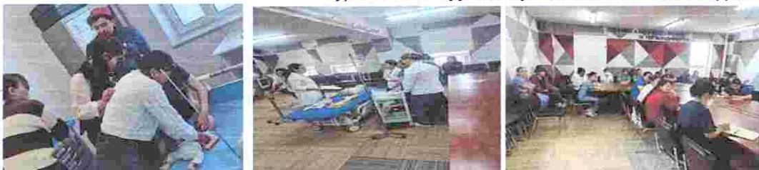
Зураг 4. “Амилуулах тусламж хөх код идэвхижүүлэх” сургалт