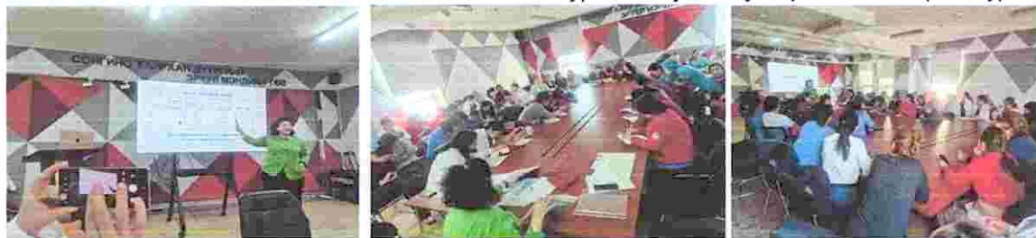
Зураг 7. "Сувилахуйн үнэлгээний арга" сургалт

7. Хог хаягдлын тухай хуулийн 8.3.2 дахь заалтыг хэрэгжүүлэх зорилгоор тушаах нь : 2017.12.12 А173 А/193 тушаалын дагуу Хог хаягдлыг ангилалах, цуглуулах, хадгалах устгах талаар эмч ажилчдад сургалт орсон. Сургалтад 5 асрагч хамрагдсан.