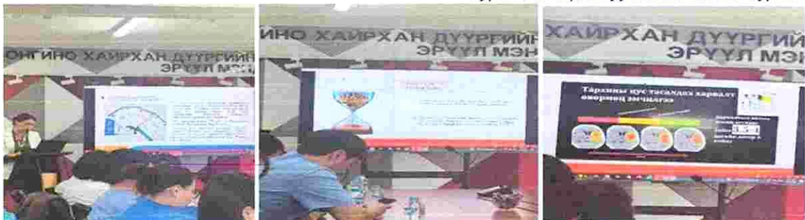
Зураг 13. "Бүлэн уусгах эмчилгээ" сургалт

13. СХДЭМТ-ийн Мэдрэлийн өвчин судлалын тасгийн сургалтын багийн гишүүн Б.Мөнхшонхор эмч " ГЛАЗГО ҮНЭЛГЭЭ " сэдэвт сургалтыг 03 дугаар сарын 02 өдөр зохион байгуулсан. Сургалтанд тасгийн 14 ажилтан хамрагдсан.